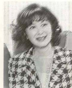
ゲスト 岸 恵子