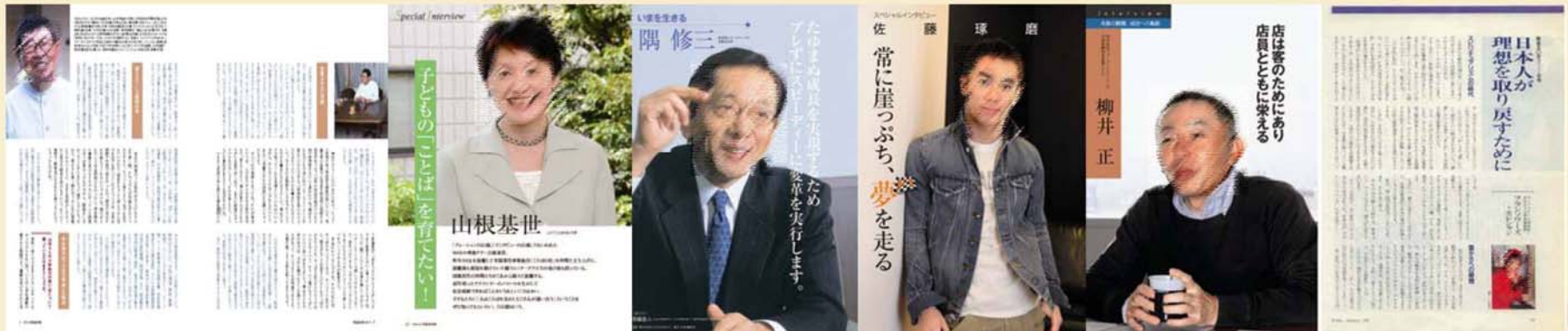
早稲田学報(早稲田大学校友会)より