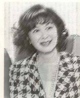
ゲスト 岸 恵子