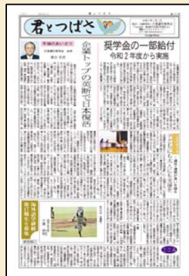
交通遺児育英会広報紙「君とつばさ」

ジャパンエナジー(社内誌)、マツダ(カタログ)、NTT(NTTビジネス)、JR東日本(リクルートもの)、JR西日本(リクルート、社内誌)、文化放送プレーン(リクルートもの)、いすゞ自動車、新明和工業