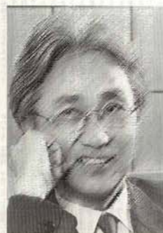
種々の話は尽きない。