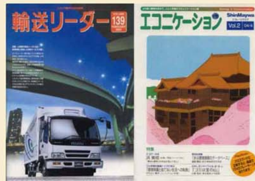
輸送リーダー(いすゞ自動車)